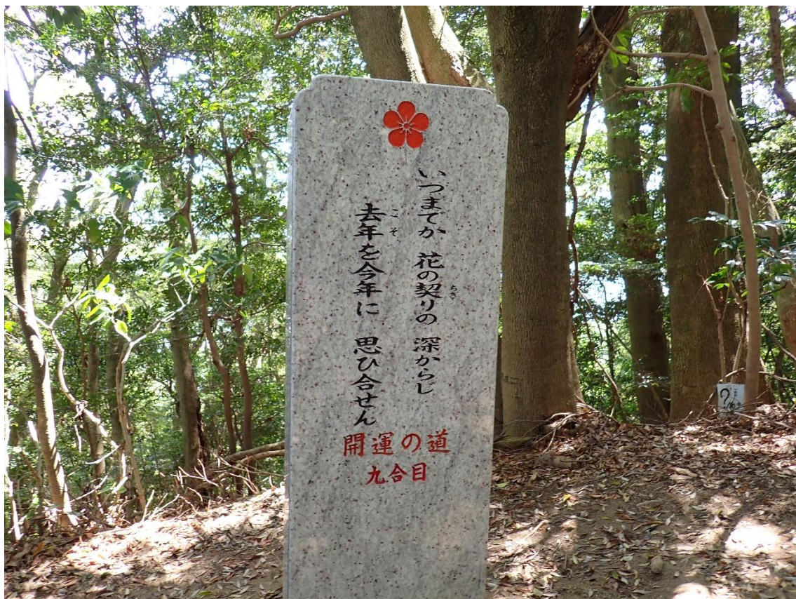
開運の径 九合目 11:23 通過