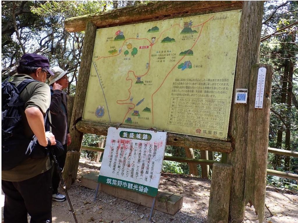
八合目分岐 11:28 この分岐から飯盛城跡を目指す！