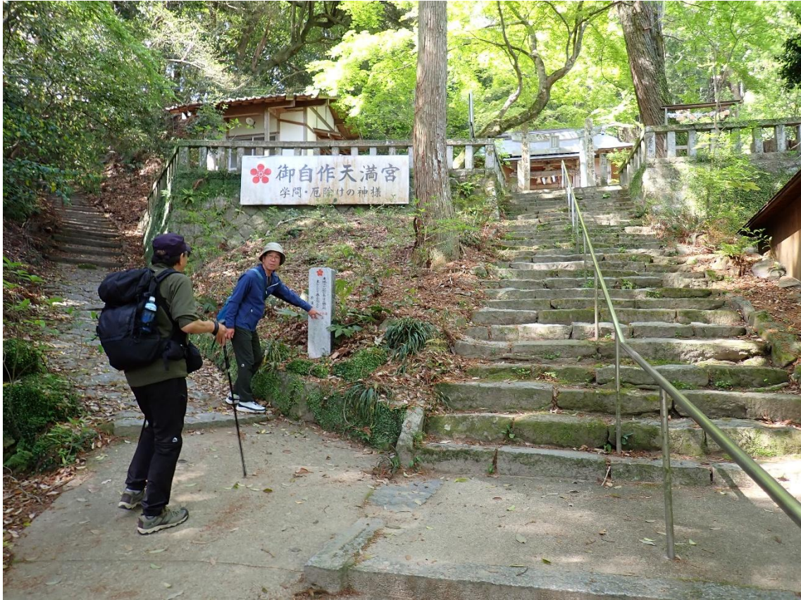
天神さまの径 起点 9:48 階段左手の道に入る