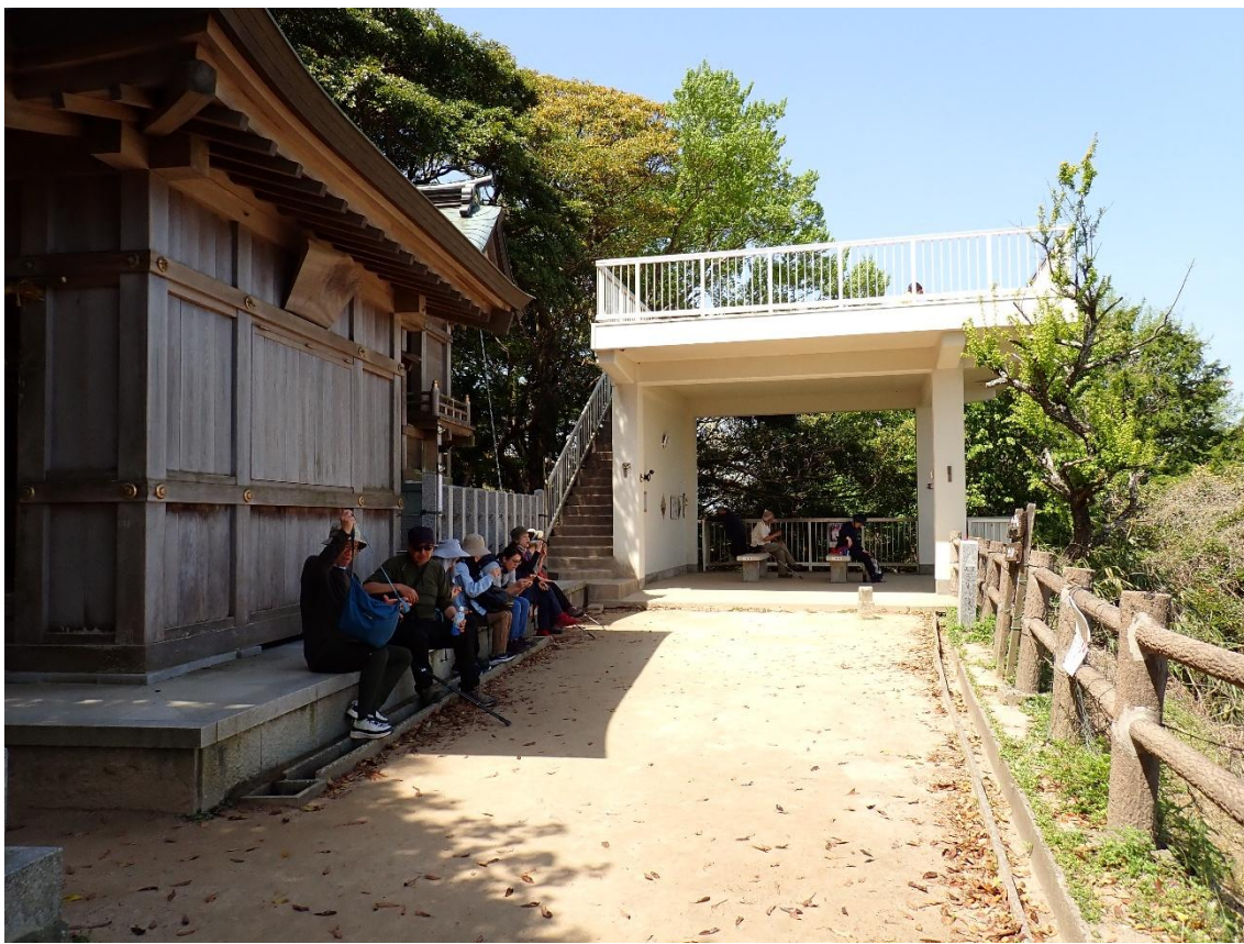
展望台下で休憩 11:00 気温は22℃(展望台下の日陰)