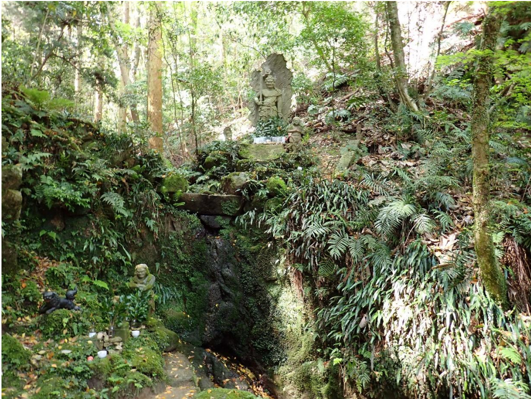
行者の滝 10:25 途中立ち寄ったが水は枯れていた 滝の上から不動明王がこちらを睨んでいる