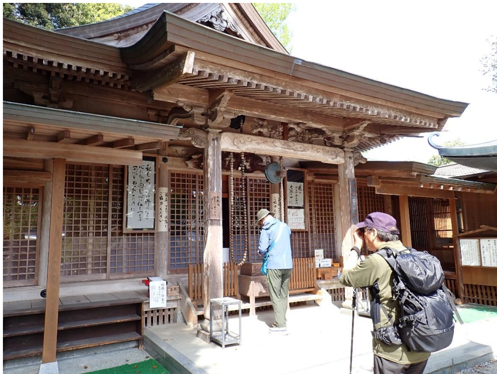
武蔵寺(ぶざうじ) 9:42 日頃の安全登山の祈願と御礼参拝 ここ武蔵寺は飛鳥時代に創建、九州最古の寺院といわれ、県指定の史跡文化財。