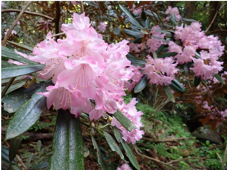
石楠花(シャクナゲ)