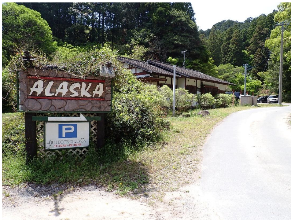
登山道を下るとステーキ店の横を通る 12:41 ここから車道を歩き周回