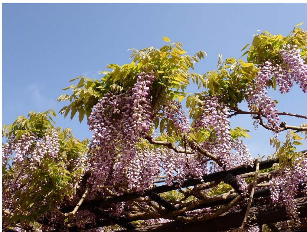
盛りには少し早いようだったが、バッチリ！