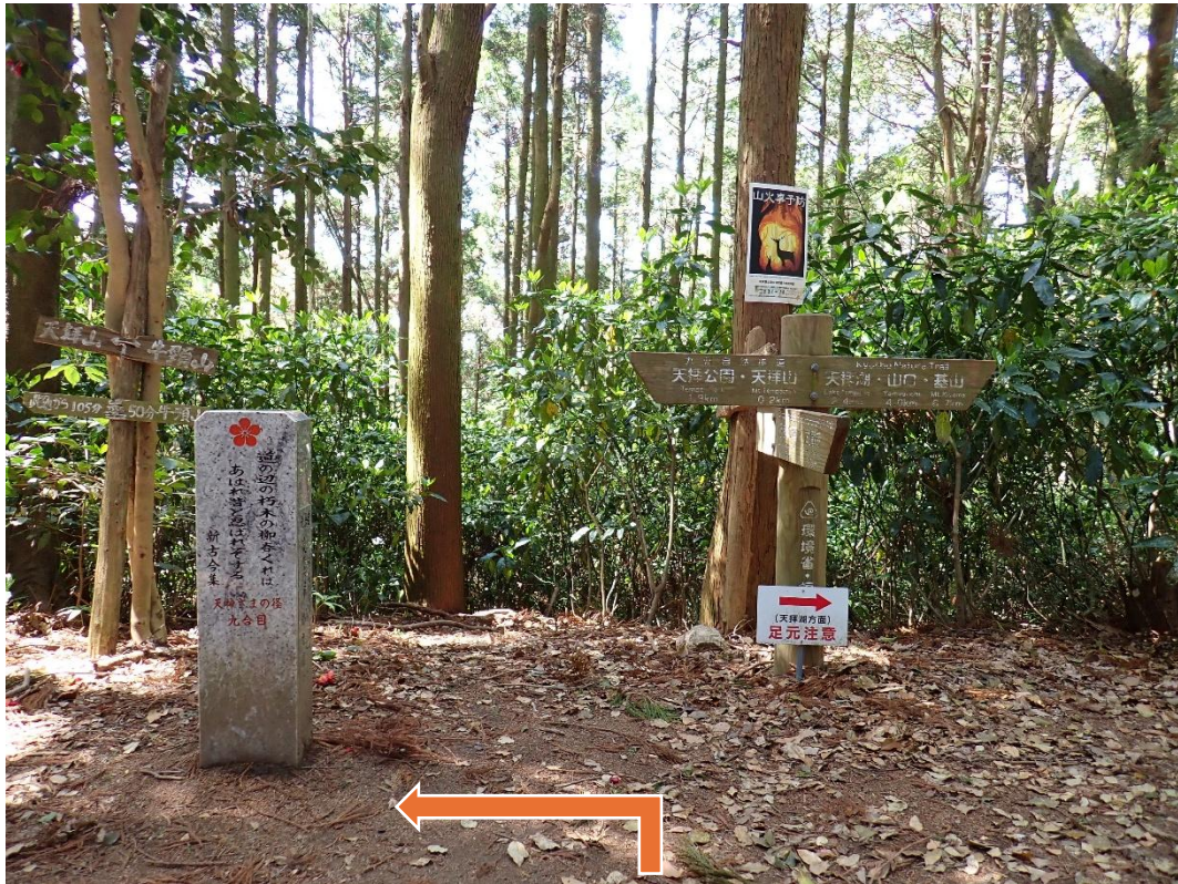
分岐(天神さまの径 九合目) 10:39 天拝山まで200m