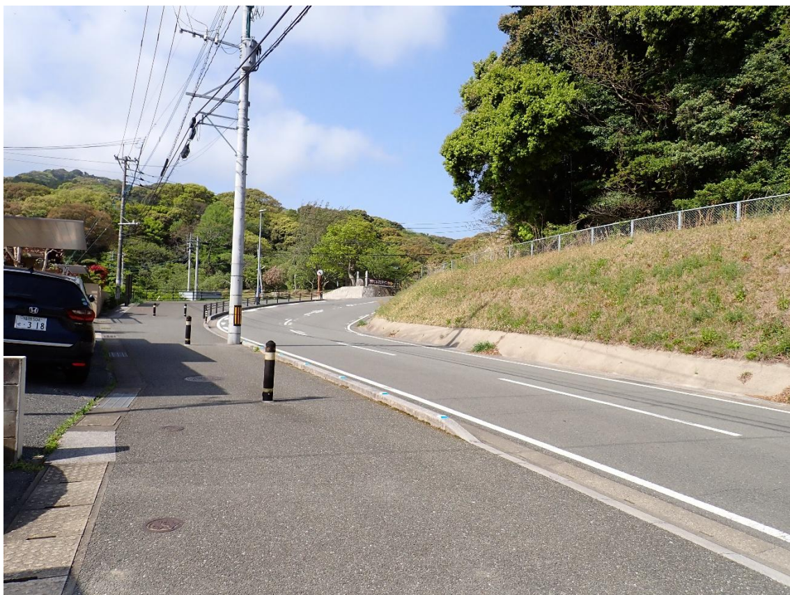
駐車場を出て、天拝山歴史自然公園に続く歩道を歩いて行く 9:23