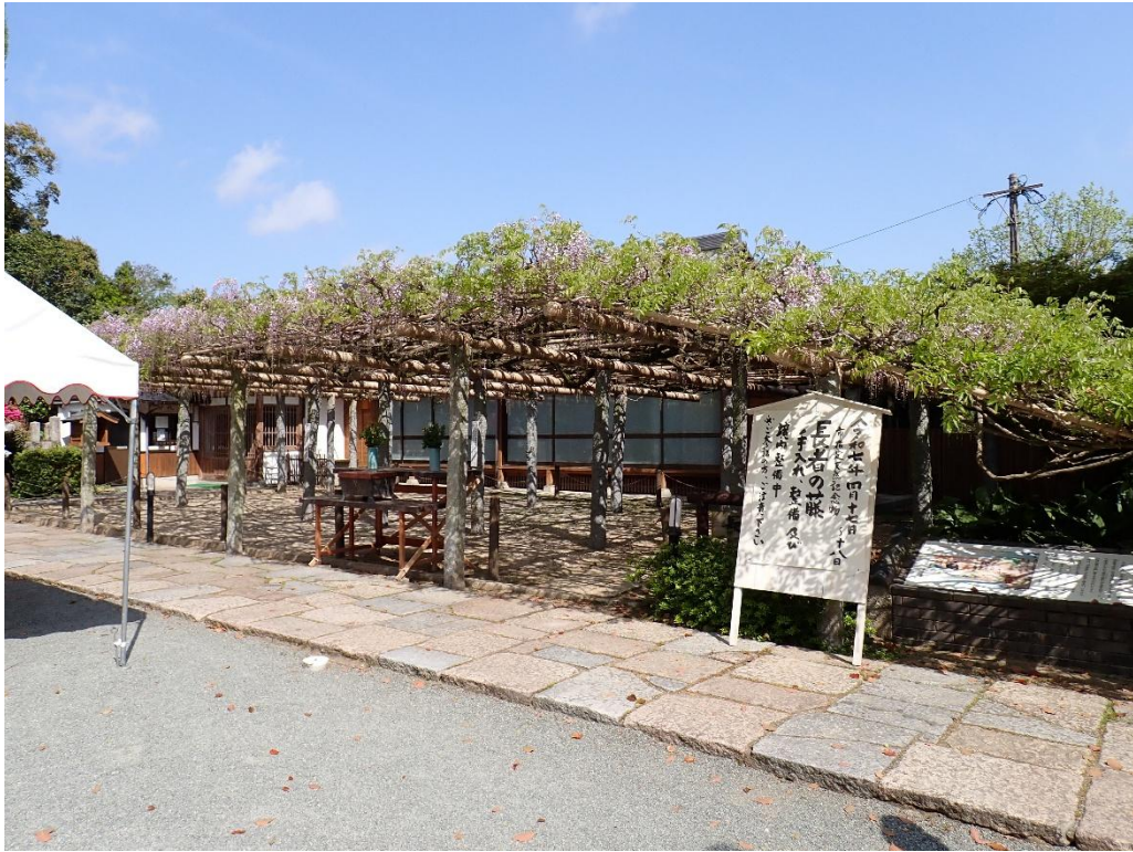
武蔵寺境内 市指定天然記念物「長者の藤」 9:39 こちらの藤棚は3分咲き位だろうか？