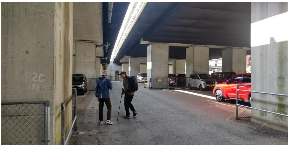
高速道路の下にある市営駐車場 9:20 なんと 4 時間まで無料だ！