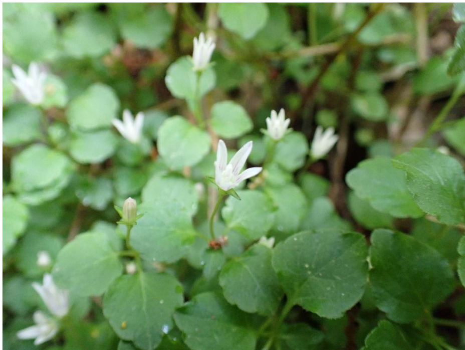
小さくて可愛い白い花。 ツクシタニギキョウかな？