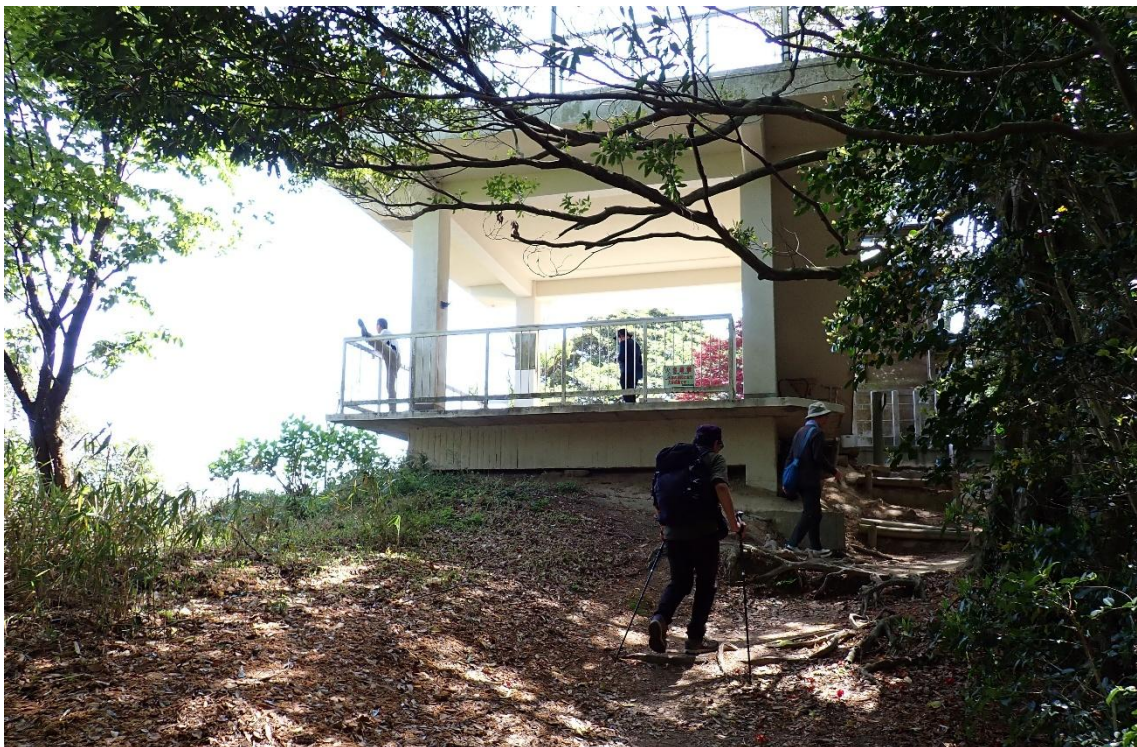
展望台があるぞ、上ってみよう！