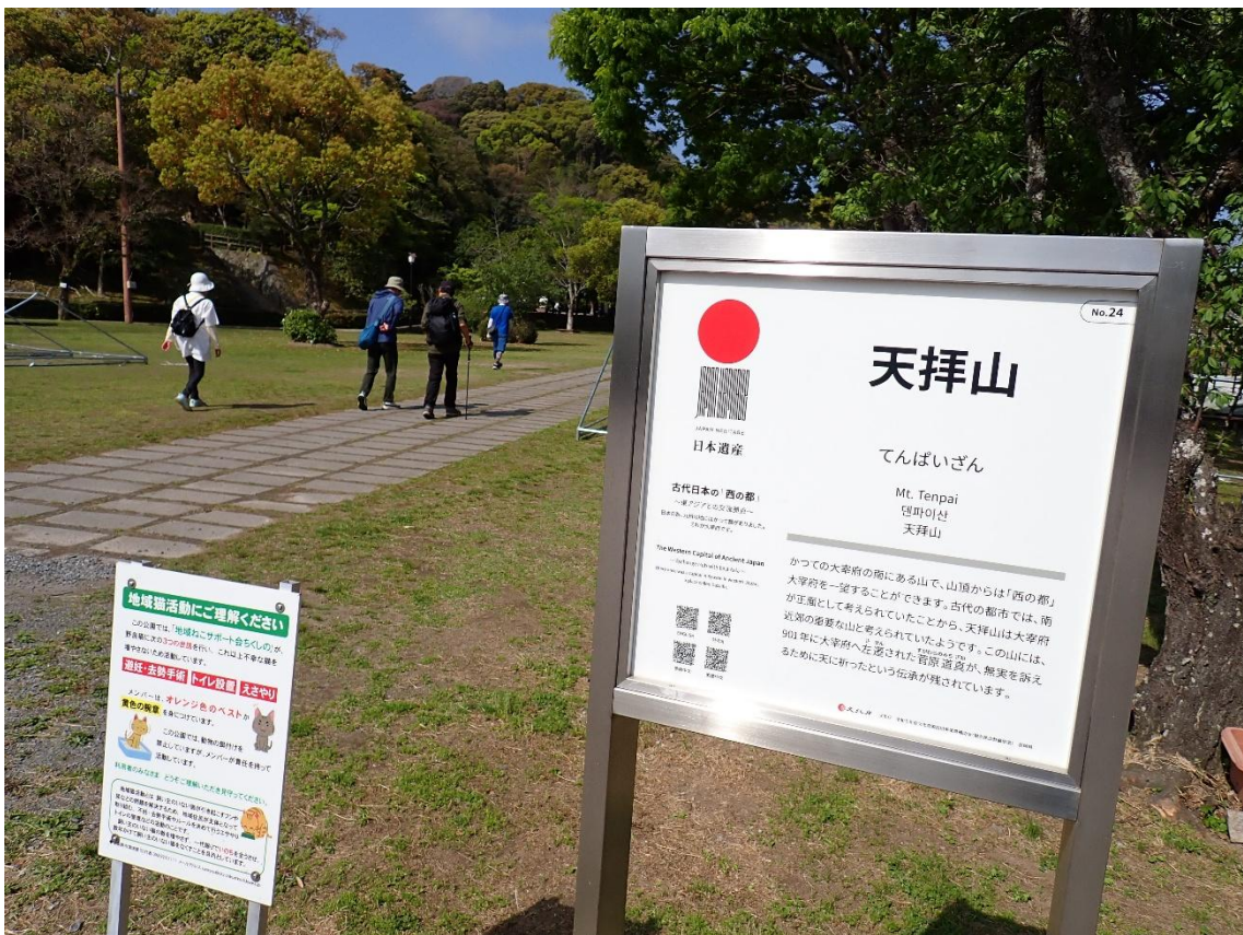
天拝山歴史自然公園 9:28