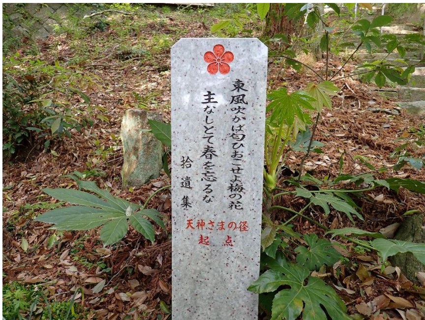
東風吹かば 匂いおこせよ梅の花 主なしとて春を忘るな