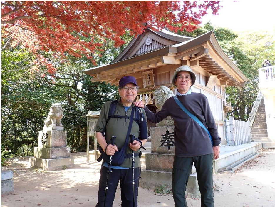
T師匠とU師匠(天拜山社の前にて)