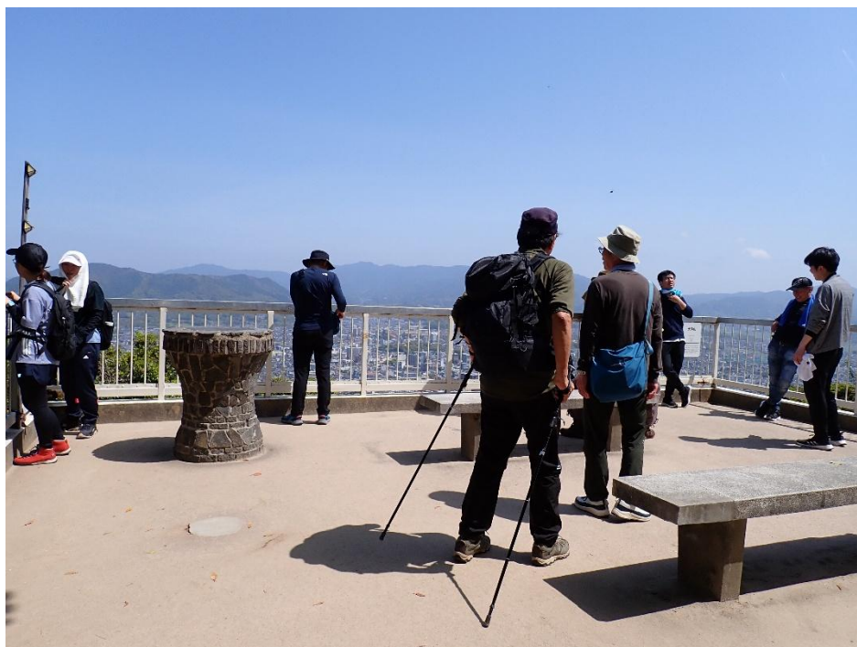
天拝山 10:48 沢山の人が景色を楽しんでいた