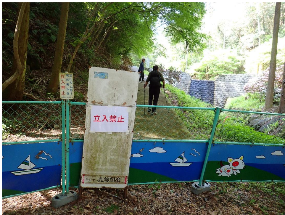
途中で立入禁止の貼り紙があるが、通行OKとのことだった。紛らわしい。 10:04