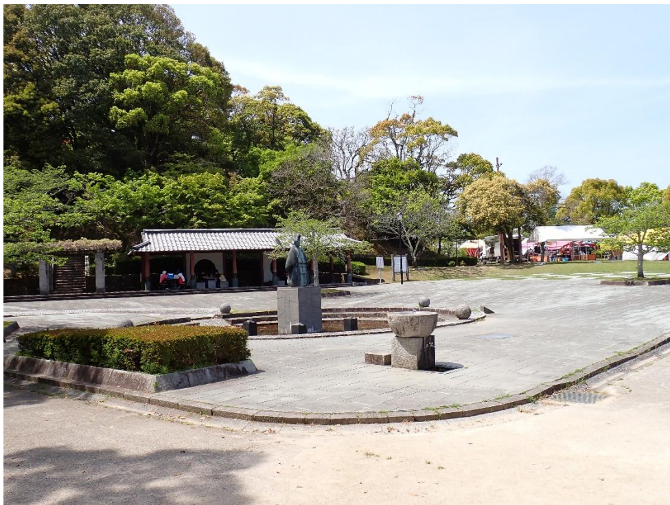
天拝山歴史自然公園 12:55