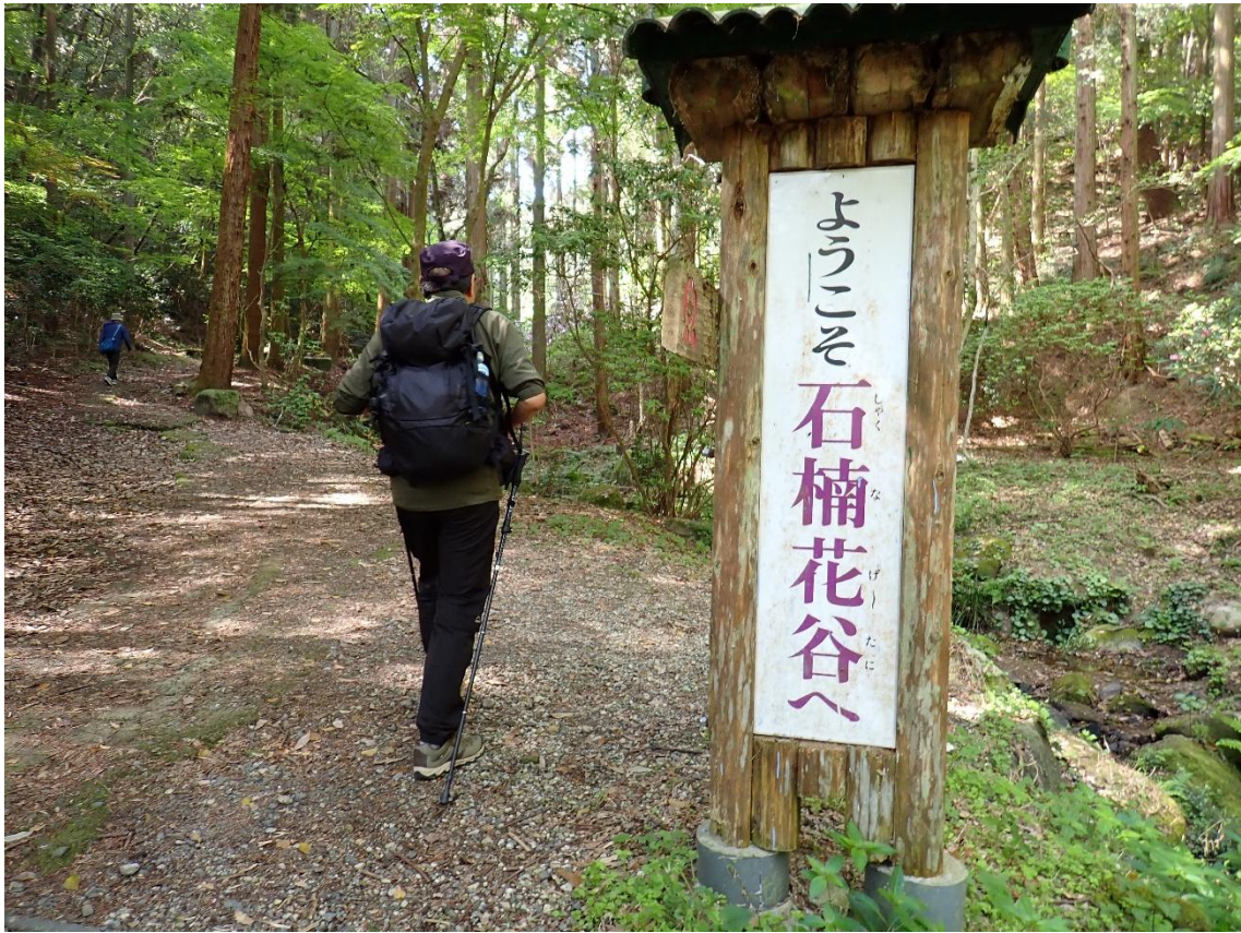
石楠花谷 9:57 辺りにシャクナゲが咲いて登山道沿いが明るくなった