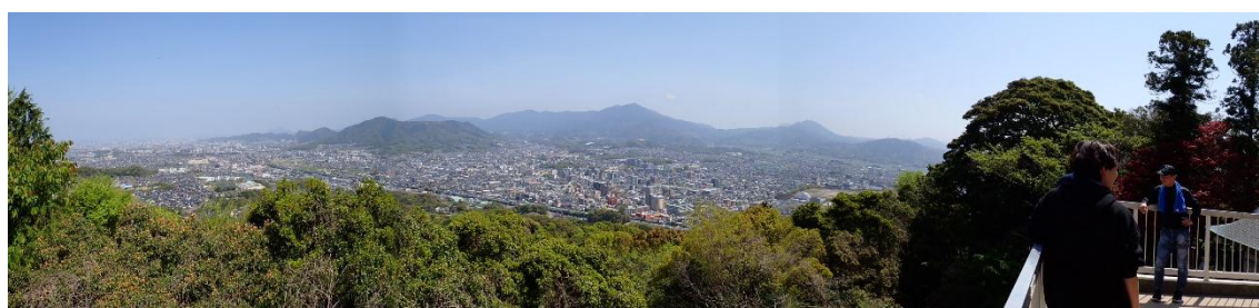
山頂展望台からのパノラマ。正面には宝満山。九州国立博物館の大屋根も見える。