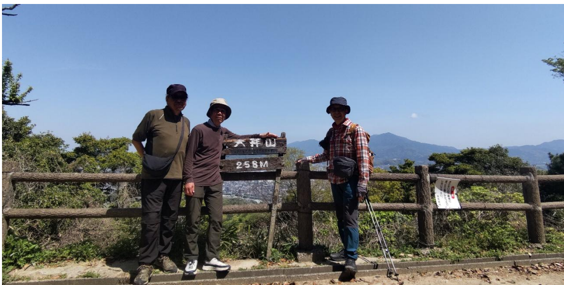
山頂でスリーショット 11:10 完全に逆光でした(泣)