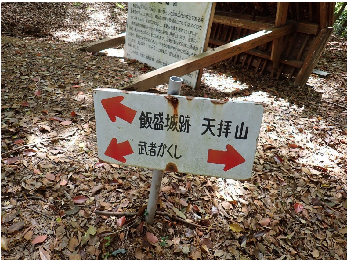
昼食を終え武者隠しへ向かう 12:20