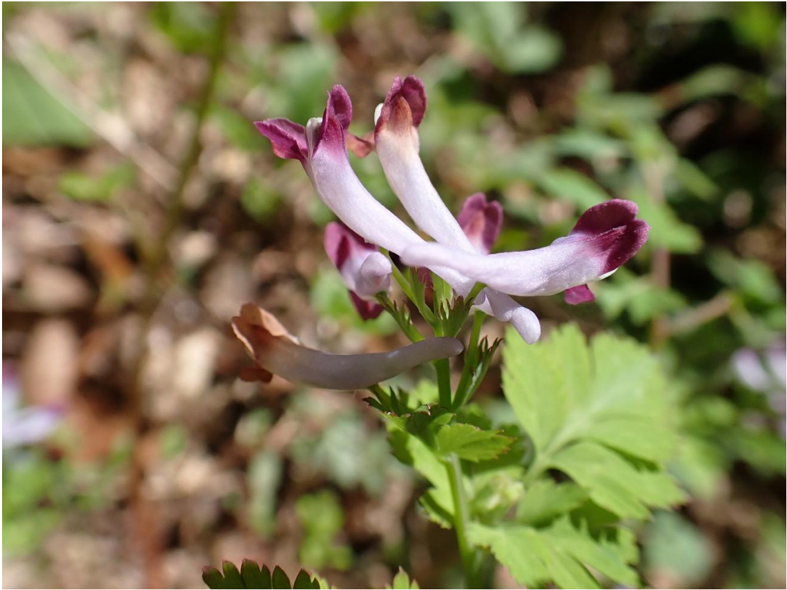
ムラサキケマン？ エンゴサク？ 見極めが分からない。