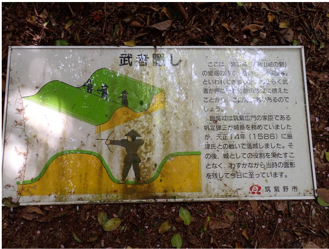
武者隠し 12:33 壁堀に隠れて敵の攻撃に備えたそうだ