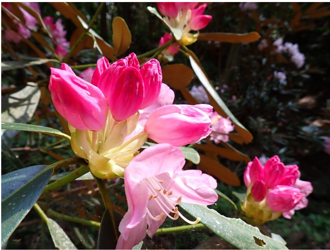
石楠花のツボミはピンクが濃い