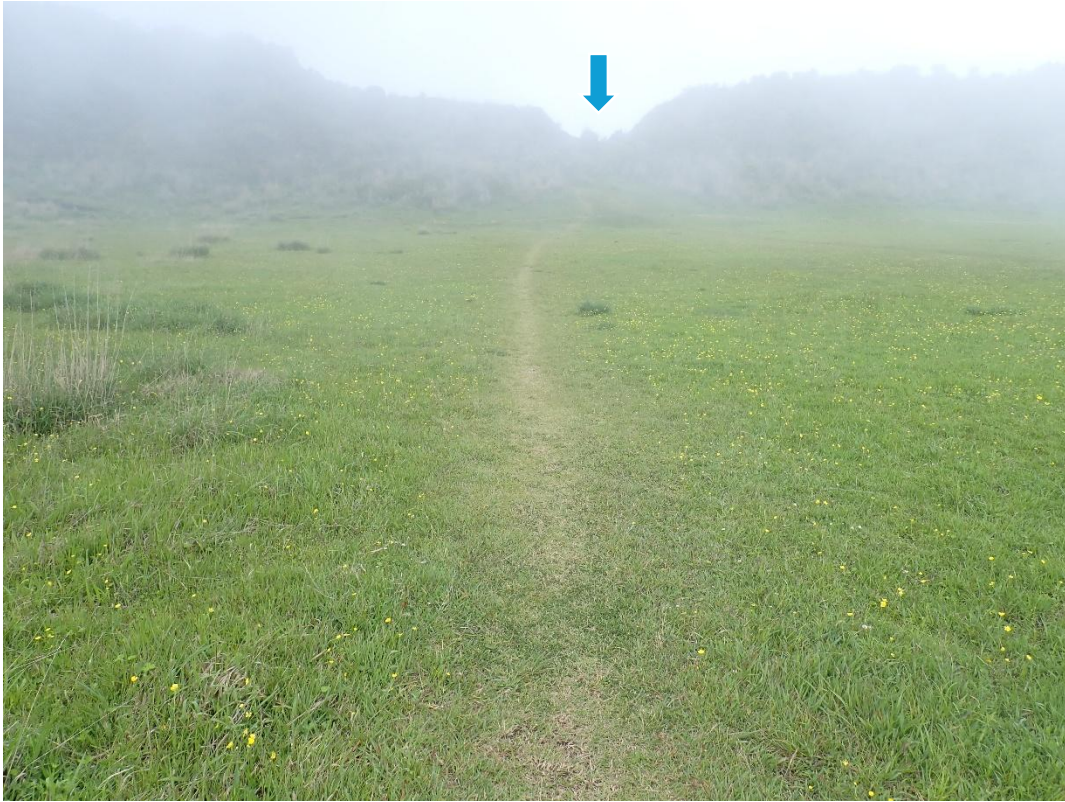
踏み跡を外さないように歩いて行くと… 9:05 道は窪んだ部分に続いている