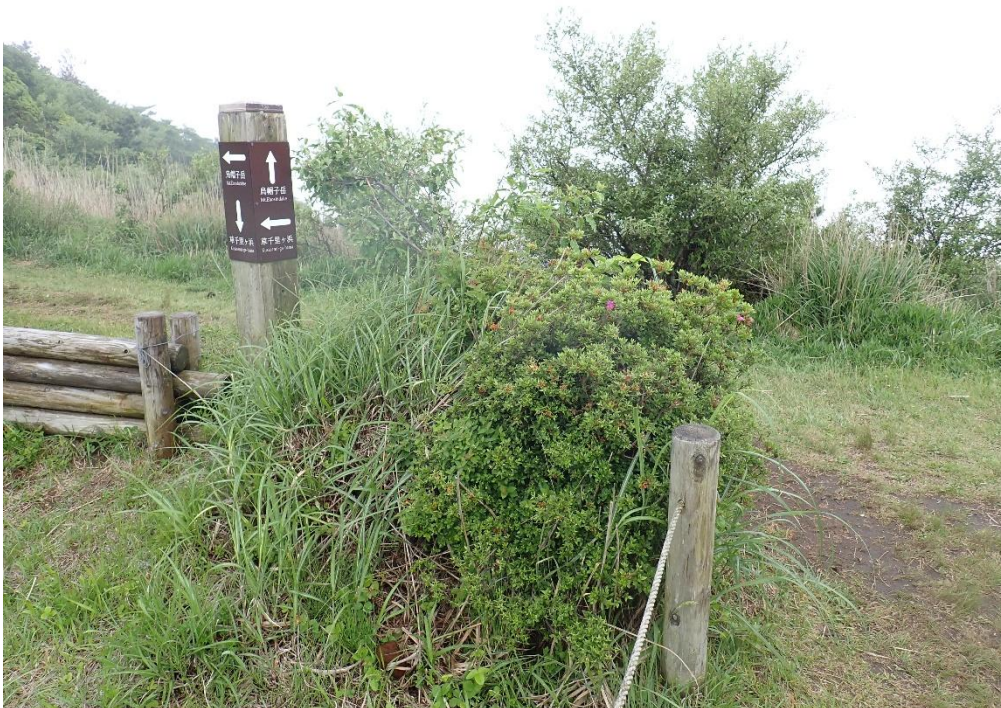
登山道に合流 9:08 左に進むと烏帽子岳