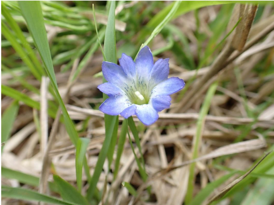
草千里ヶ浜で見つけた小さなハルリンドウ