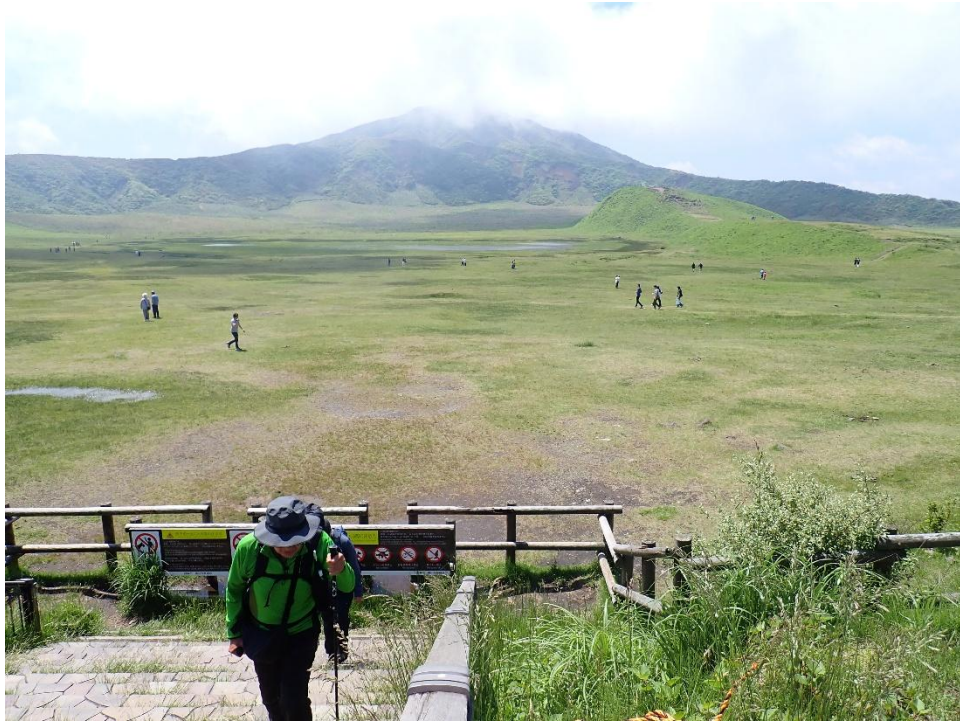
草千里ヶ浜から駐車場へ 10:51 階段を上って道路を渡る