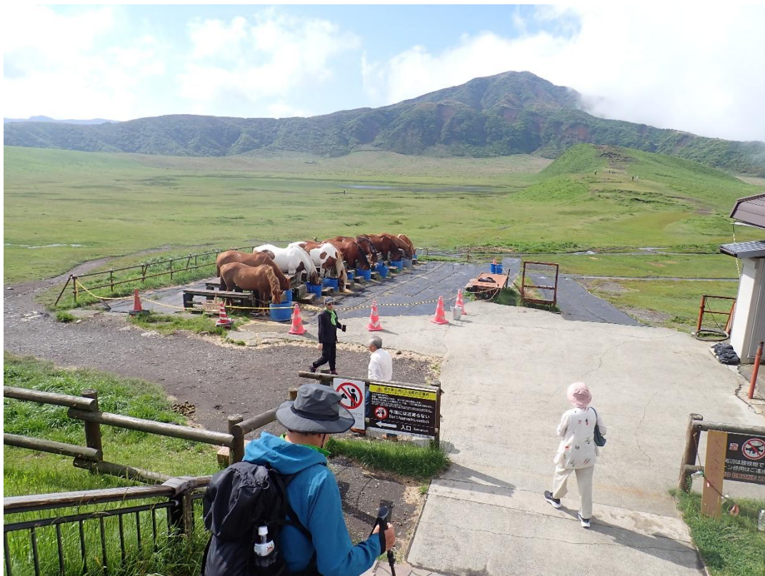
草千里ヶ浜 8:48 駐車場から道路を横断して草千里ヶ浜に入る 草千里ヶ浜乗馬クラブの馬たちが営業前に朝食中！