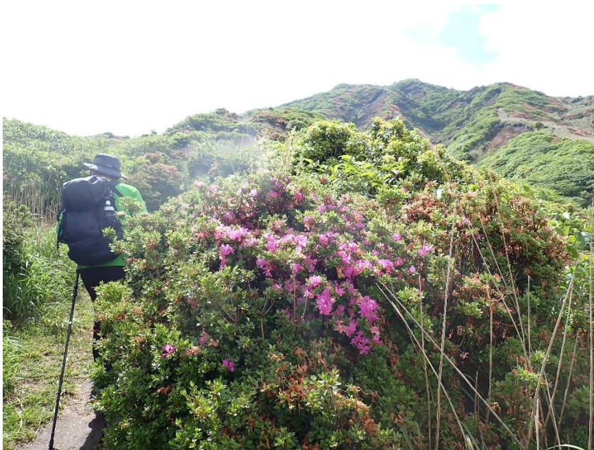
調子よく歩く 9:26 時折陽が射してミヤマキリシマが輝く