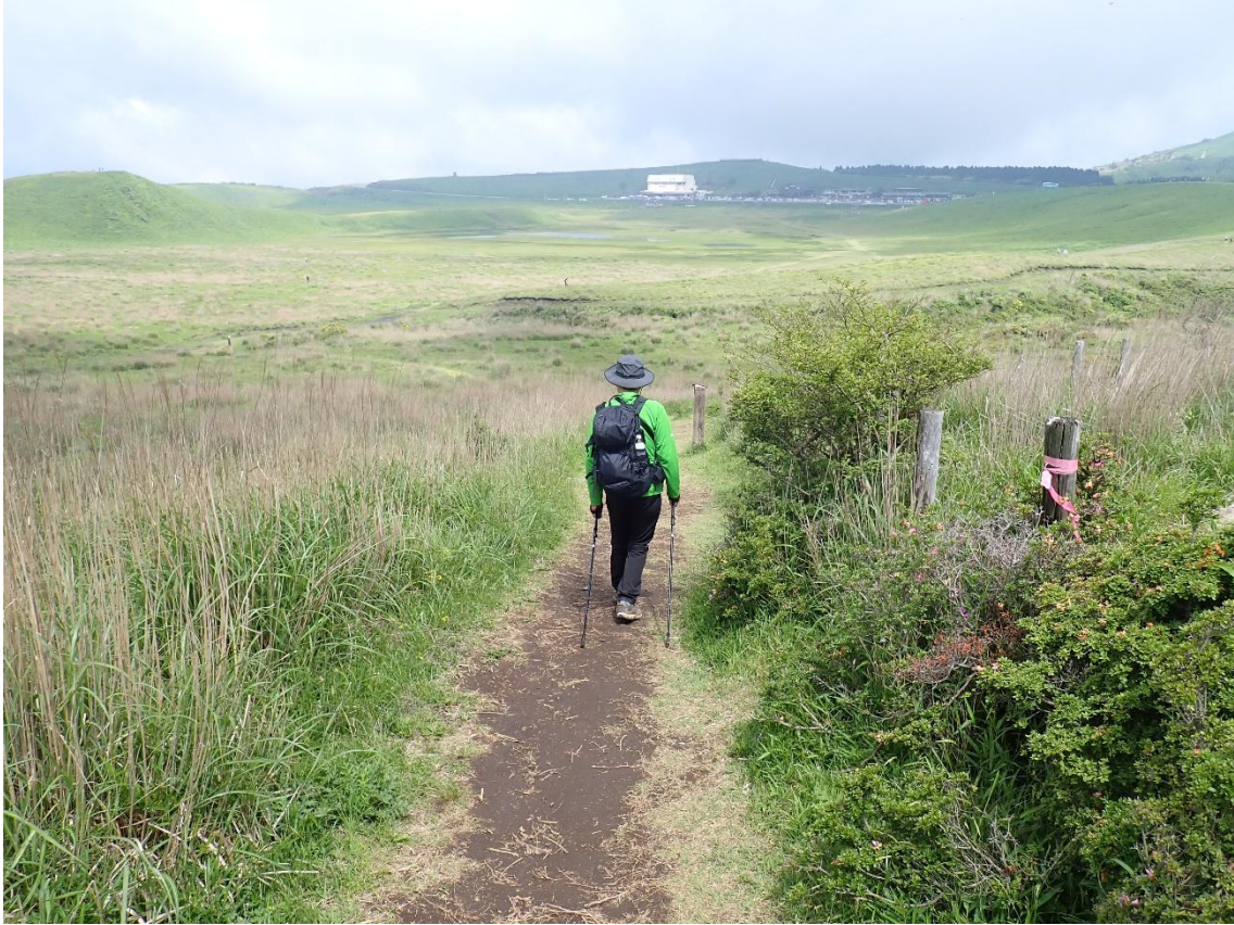
草千里ヶ浜 10:33 山頂からここまで30分で下ってきた