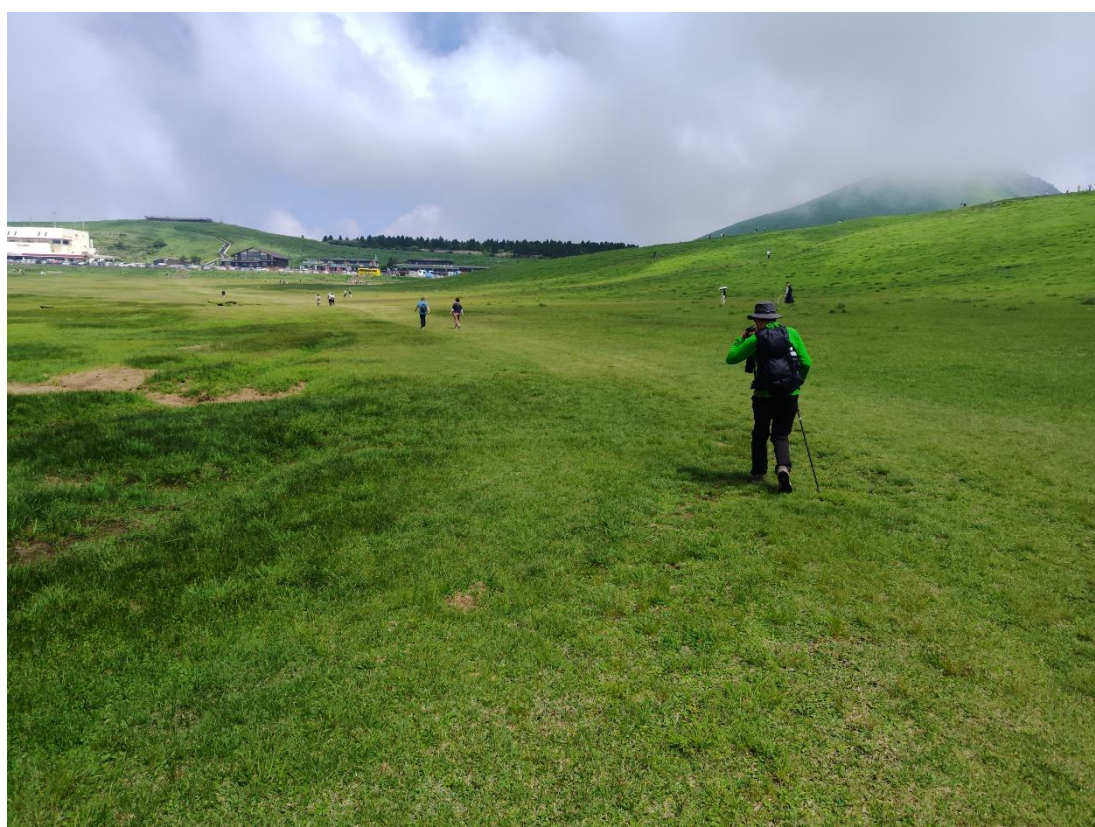
草千里ヶ浜を散策する観光客も多い 10:42 駐車場に向って歩く