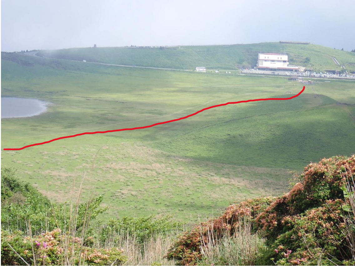
霧が少し晴れてきた 9:24 草千里ヶ浜を見下ろすと、歩いてきた道筋が確認できる 駐車場から赤い線に沿って歩いてきたことになる