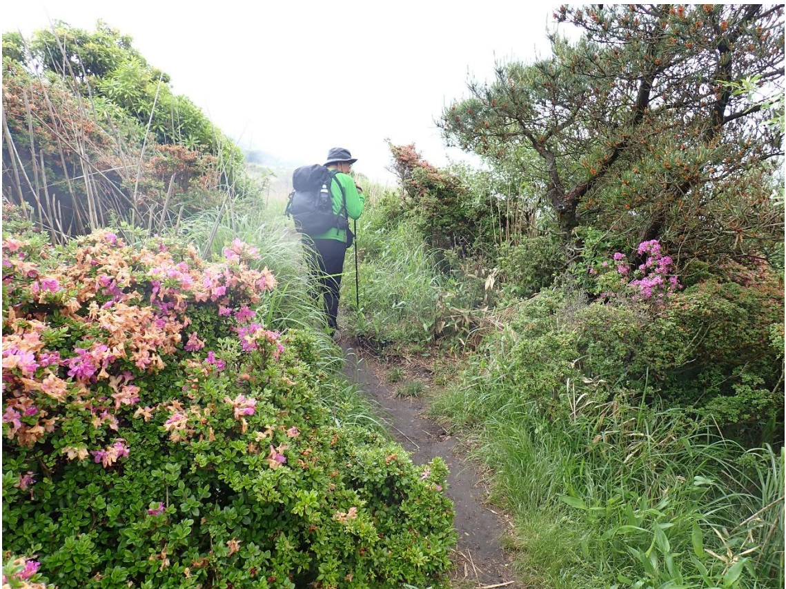
ミヤマキリシマが現れたが・・・ 9:18 残念ながら既に終期