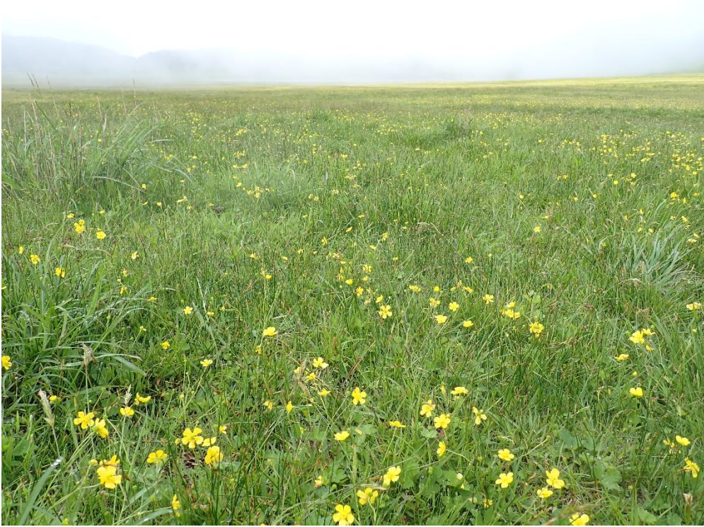
少し歩くと黄色い花が一面に咲いている この花は「ウマノアシガタ」で有毒。放牧される馬も食べないので蔓延っているのだろう。