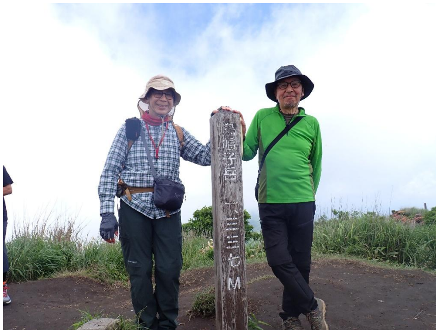
烏帽子岳 9:52 1337m 山頂では雲に包まれて視界ナシ

このまま下山して帰るのも物足りない気分で、この後、杵島岳にでも登ろうか？などと相談していたら、山頂で出会った単独行の男性から、「杵島岳に登るくらいだったら皿山にしてみたら？」と、アドバイスを頂いた。それならばと、二座目の皿山を目指して下山することにした。