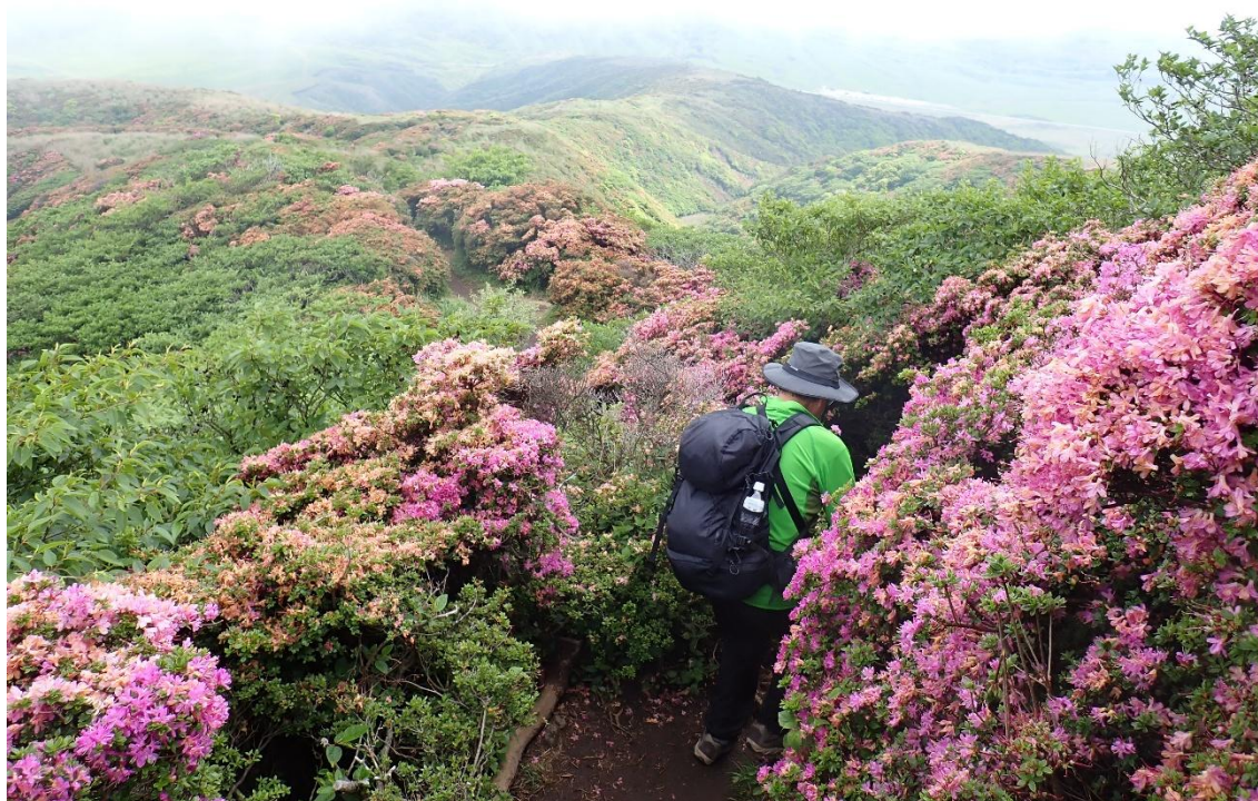
ミヤマキリシマの群落の中を進む 10:11 いい感じ