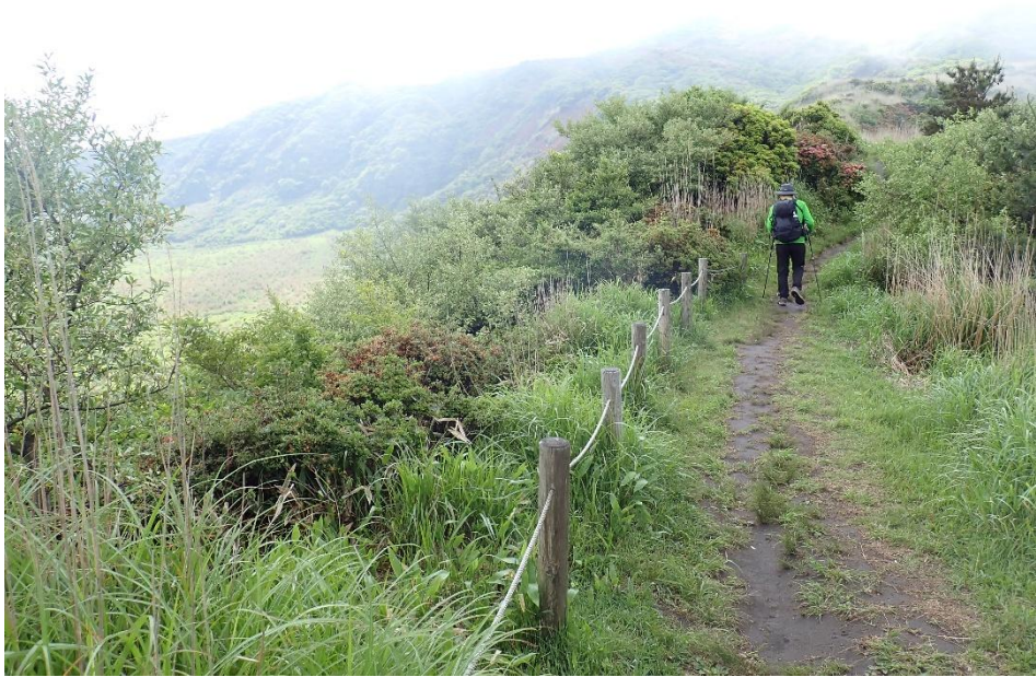
最初はなだらかな登山道 9:17