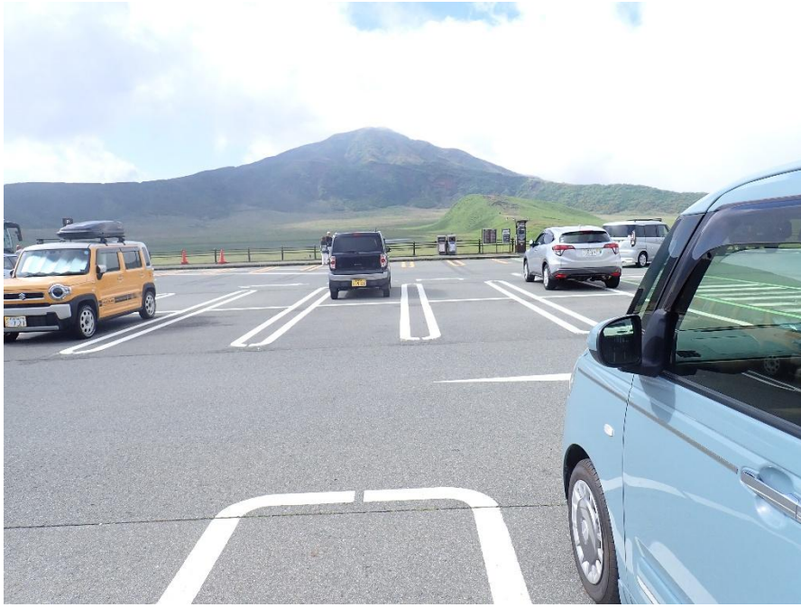
草千里駐車場 8:45 正面に見えるのが烏帽子岳 この標高は1138m ・ 収容台数は200台