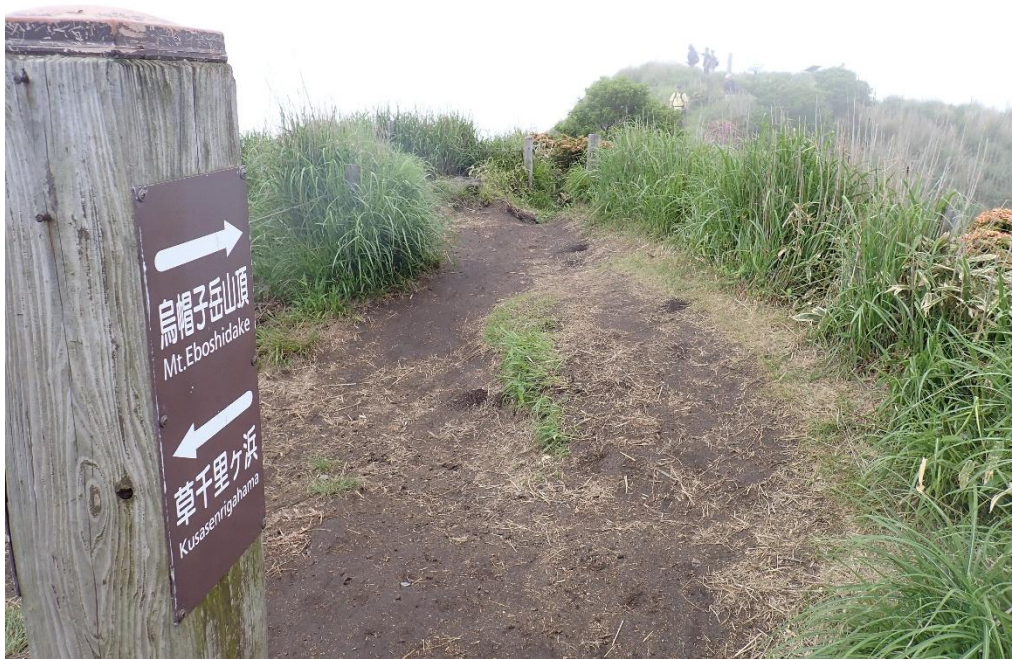
山頂手前にある草千里ヶ浜への分岐 9:50 前方に見えるのが山頂