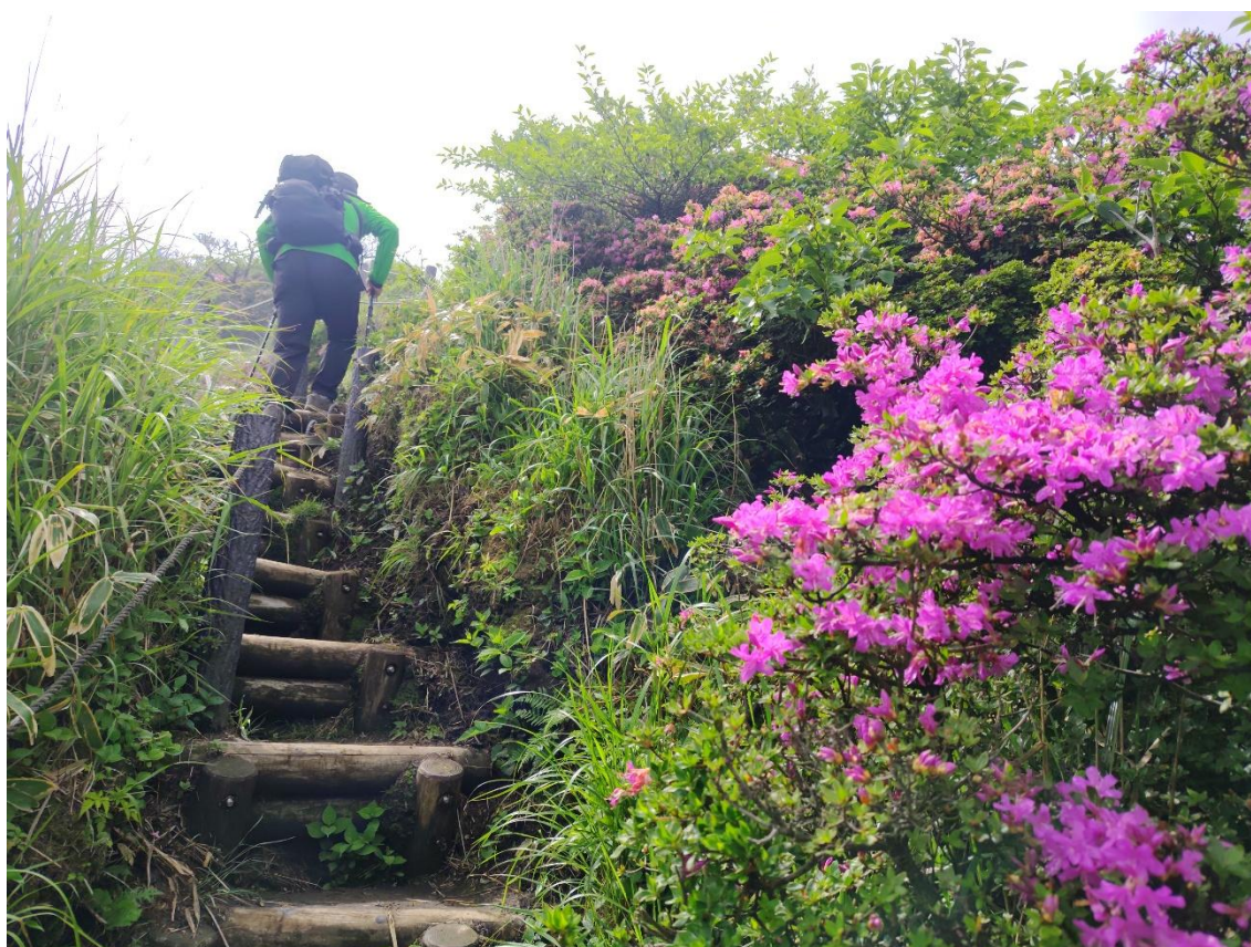
山頂に近づくにつれて急勾配となる 9:41