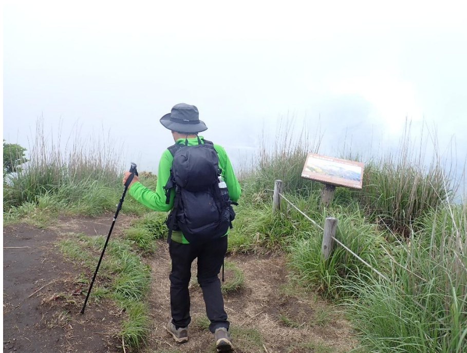
分岐まで戻って草千里ヶ浜を目指す！ 10:03 景色を拝めず残念