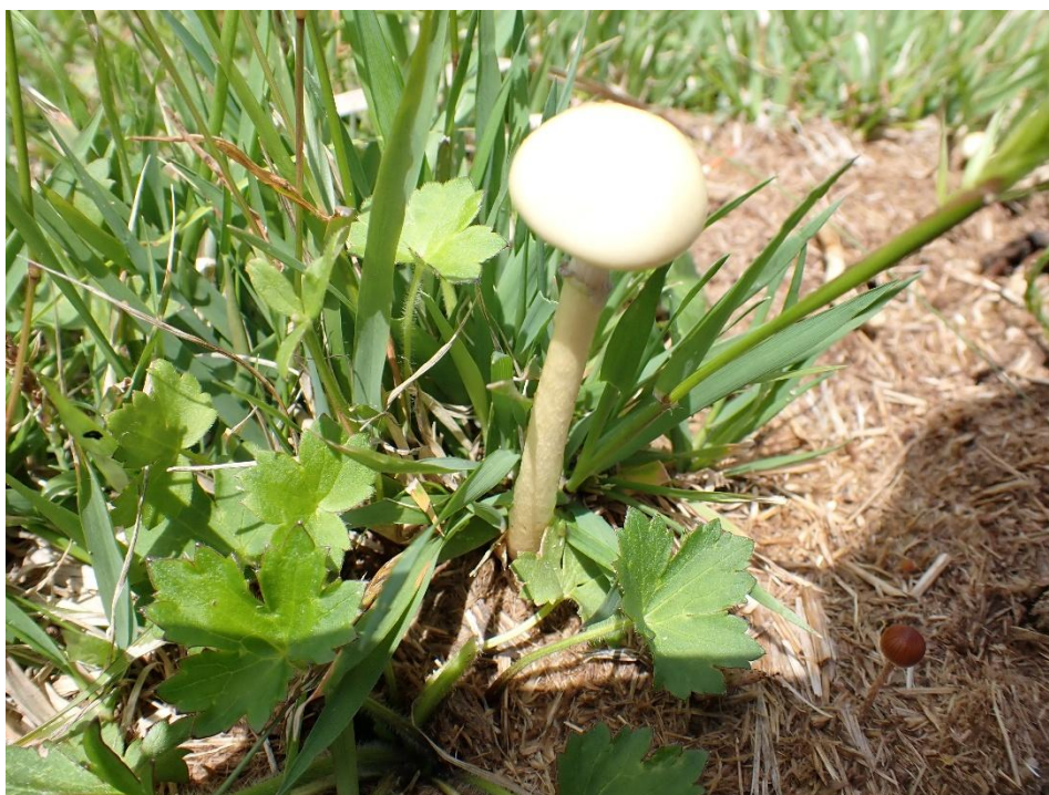
小さなキノコも見つけたが、白いキノコは有毒なものが多いので要注意！