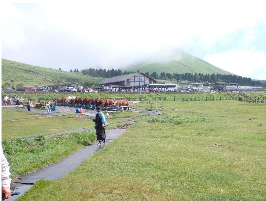
振り向くと後ろに聳える杵島岳(きじまだけ)にも霧がかかってきた