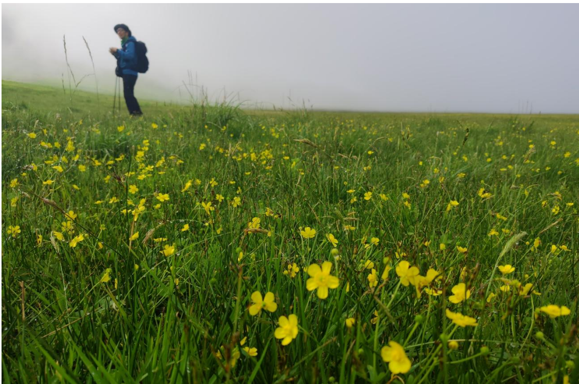
気がつくと辺りは霧に包まれて真っ白 8:56 幻想的になってきた