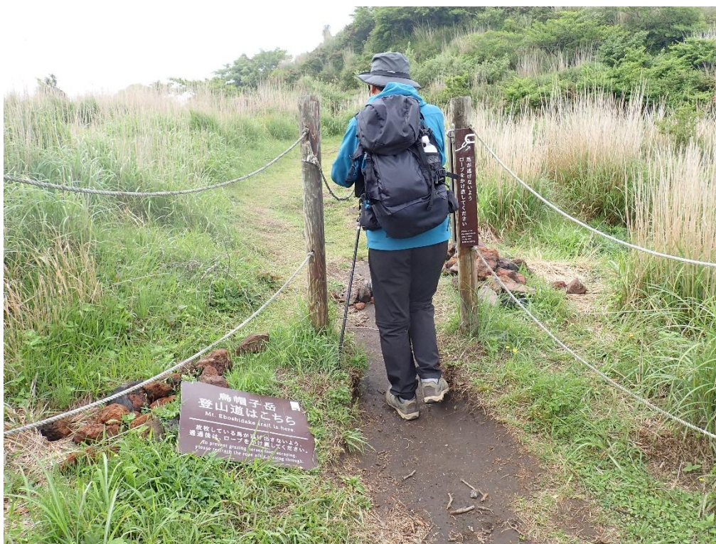
ゲート 9:09 放牧の馬が逃げないようにロープを忘れずに！