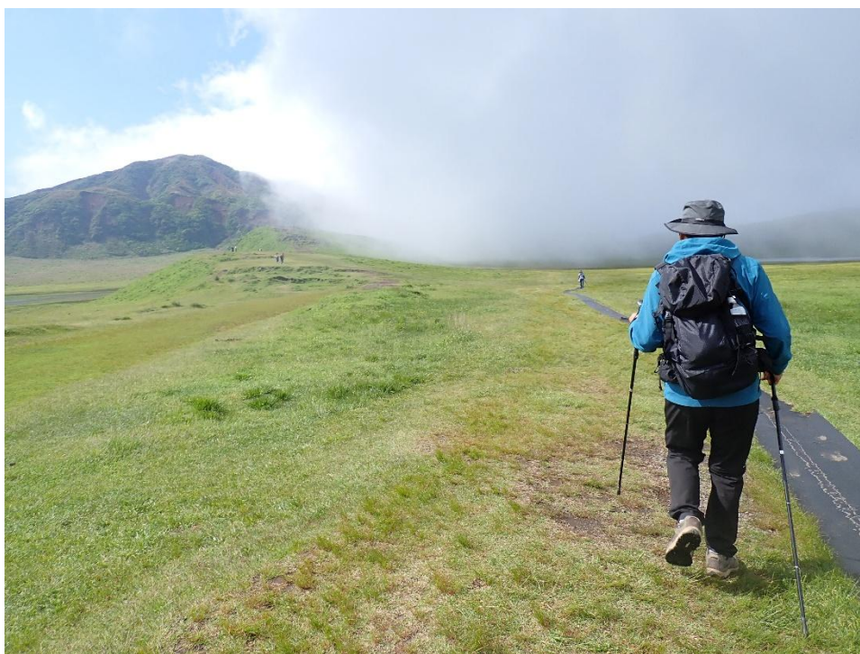
まずは乗馬コースに沿って歩く 8:54 あれっ？ 霧が出てきたぞ(悲)