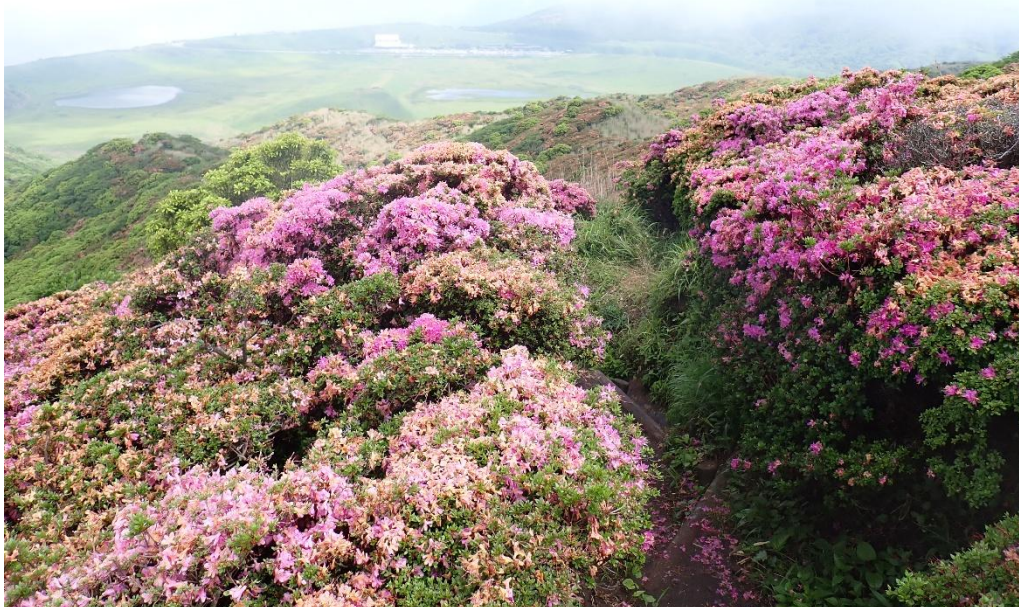
標高を上げてきた 9:36 草千里ヶ浜も遠くなってきた