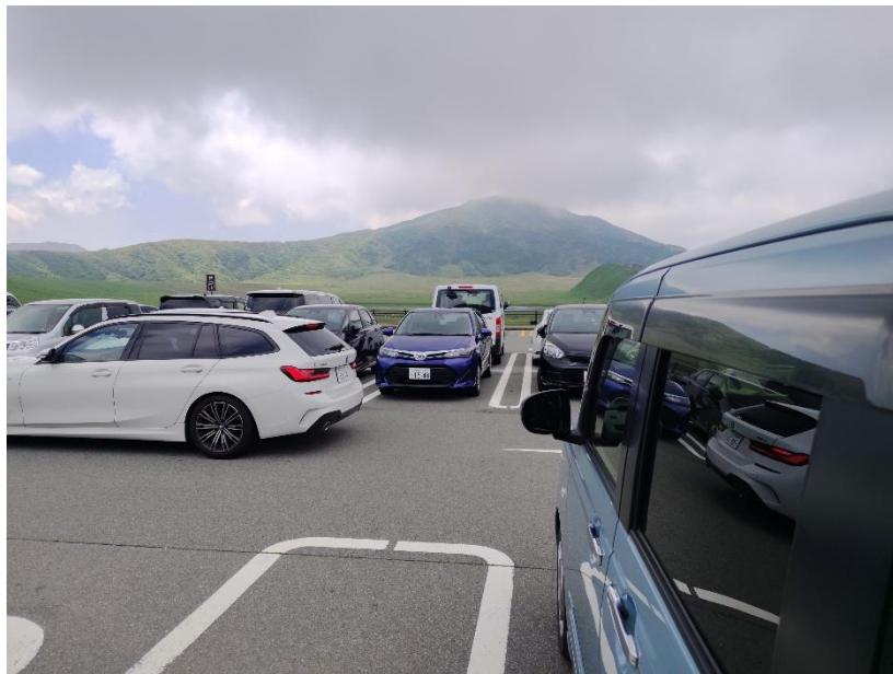
草千里ヶ浜駐車場 10:52 ゴール