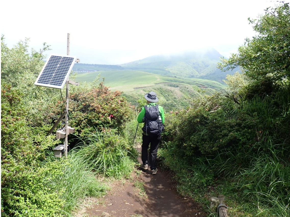
登山者数計測器を通過 10:31