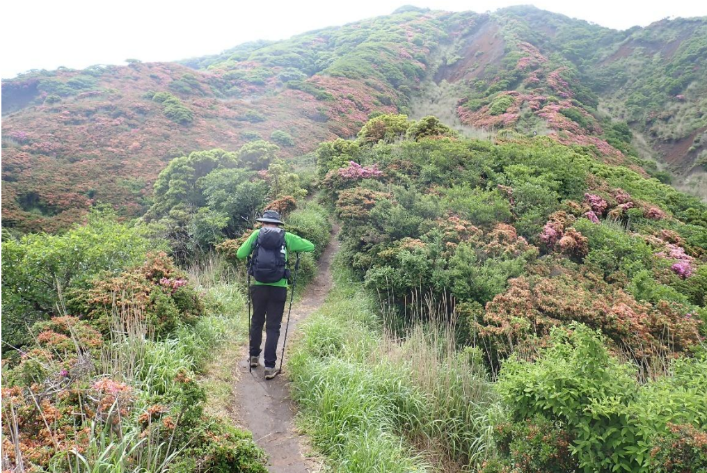
見上げるとミヤマキリシマの群生だが完全に色褪せている 9:30